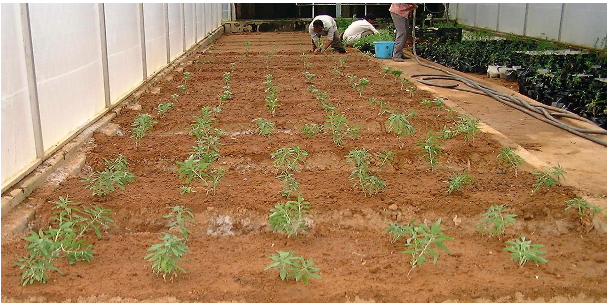
पॉलीहाउस में पौधारोपण