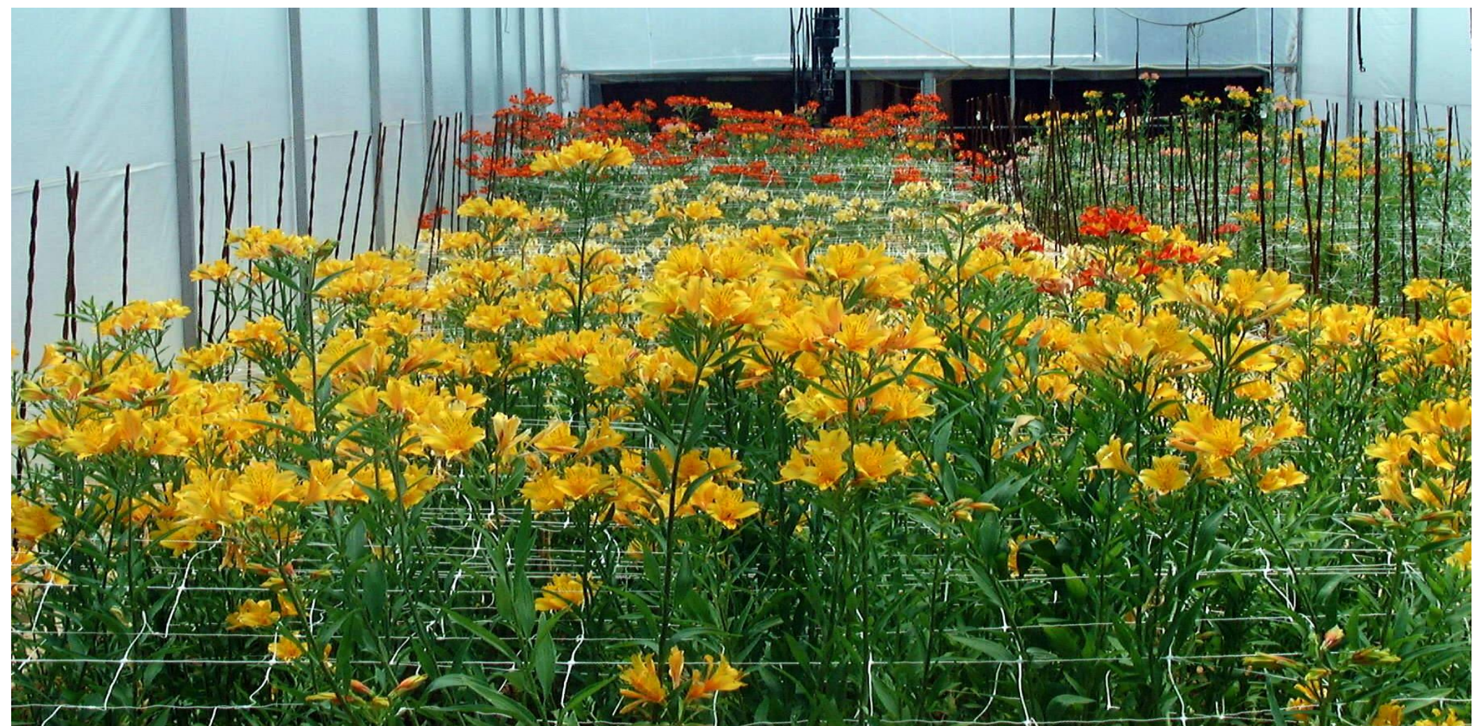
पॉलीहाउस में पुष्पण